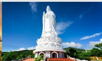
วัดลินห์อึ้ง

*ทางบริษัทฯ ขอสงวนสิทธิ์ในการสลับโปรแกรมทัวร์ตามความเหมาะสมขึ้นอยู่กับสถานการณ์หน้างาน โดยคำนึงถึงผลประโยชน์ของลูกค้าเป็นสำคัญ